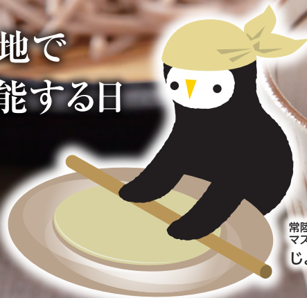
常陸太田市公式 マスコットキャラクター じょうづるさん